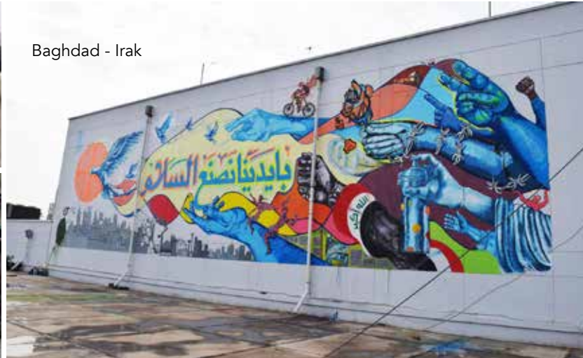
Baghdad - Irak