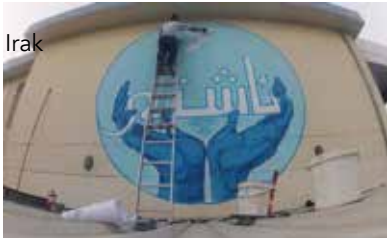
Erbil - Irak