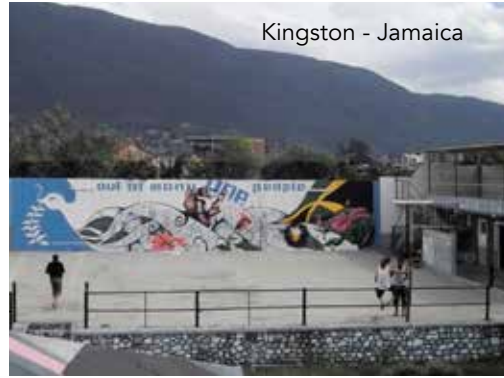
Kingston - Jamaica