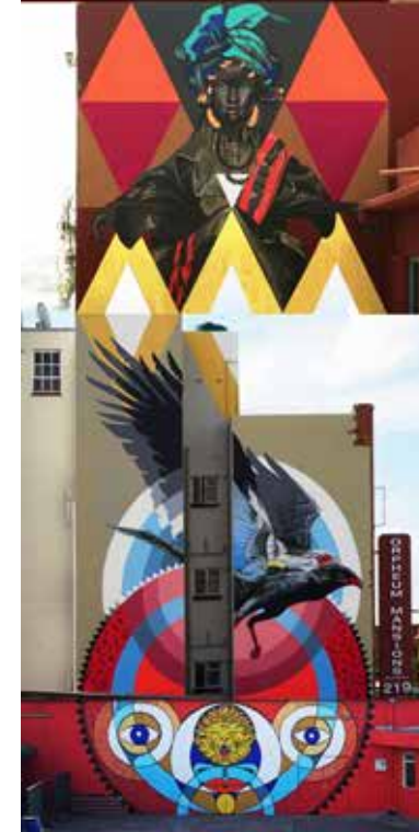
Dakar - Senegal