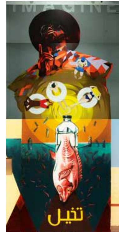
Hamburg - Deutschland